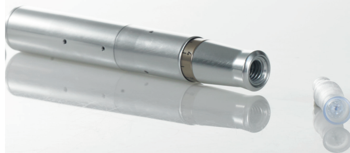
Anbefalet Meso Håndstykke

Anbefales som en mørk kontur til en meso-kontur BB-behandling i ansigtet (se billedet).